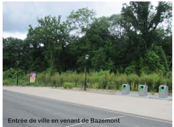
Entrée de ville en venant de Bazemont