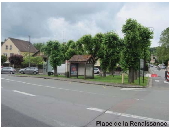
Place de la Renaissance