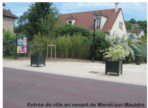
Entrée de ville en venant de Mareil-sur-Mauldre

Ces interventions majeures engendreront de fortes perturbations sur la circulation et modifieront nos habitudes pendant les mois de juillet et août.