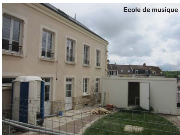
Ecole de musique

Les travaux de l'école de musique se termineront dans la première quinzaine de juillet et le bâtiment sera fin prêt pour accueillir l'ensemble des musiciens maulois à la rentrée.