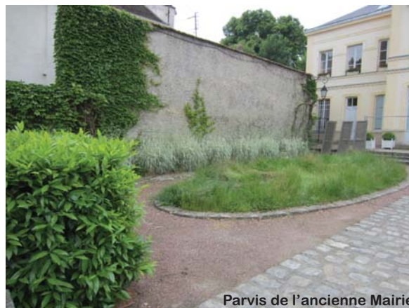
Parvis de l'ancienne Mairie

Concomitamment, débiteront les travaux d'aménagement du parvis de l'ancienne Mairie.