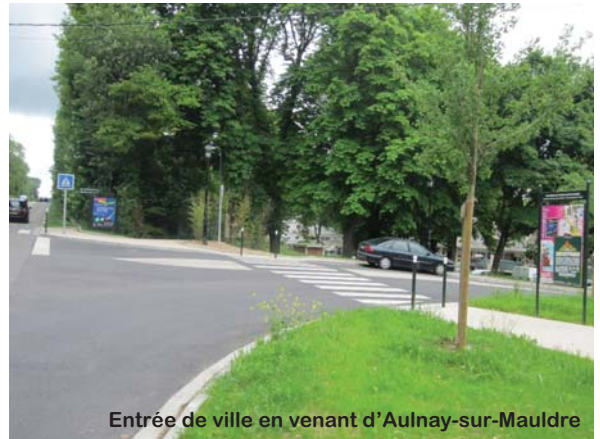
Entrée de ville en venant d'Aulnay-sur-Mauldre