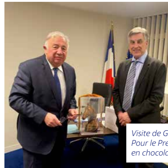
Visite de Gérard Larcher à Maule le 10 février 2025 Pour le Président du Sénat, cadeau d'une tête de cheval en chocolat réalisée par notre célèbre Chocolaterie Colas

« Bien écouter, c'est déjà presque répondre. » Marivaux