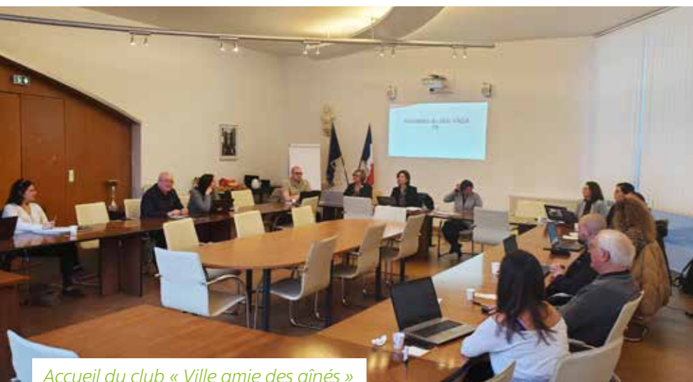
Accueil du club « Ville amie des aînés »