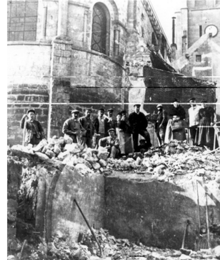
1. Démolition d'un appentis accolé à l'église

Outre ces diverses appellations, cette rue est intéressante car sa création permit une découverte archéologique.